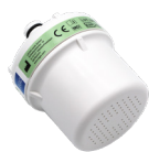
LEGIO.mini shower m